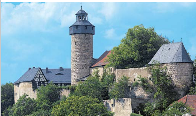
Ansicht der Burg Zwernitz von Südosten

Die auf einem schmalen Dolomittfelsen thronende Burg Zwernitz wurde im Jahr 1156 als Stammsitz der Walpoten erstmals urkundlich erwähnt. Um 1300 wurde sie Amtssitz der Burggrafen von Nürnberg und später der Kulmbacher bzw. Bayreuther Markgrafen. Vom Bergfried, von dem sich ein weiter Blick über den Naturpark Fränkische Schweiz bietet, konnten Rauchsignale über ein System von Beobachtungstürmen (Warten) bis zur Plassenburg in Kulmbach weitergeleitet werden. Von der spätromanischen Burg haben sich größere Teile erhalten, die man an den typischen Buckelquadern erkennt. In den 1740er Jahren ließ Markgraf Friedrich im Zuge der Anlage des Felsengartens Sanspareil auch die Burg wieder instand setzen. Wenn sich die höfische Jagdgesellschaft in der nahen Schlossanlage um den Morgenländischen Bau aufhielt, sollte die Burg als geschichtsträchtiger »Point de Vue« an die ritterliche Vergangenheit der Hohenzollern erinnern. Ein eigener Raum widmet sich der Dokumentation dieser Geschichte der Burg.