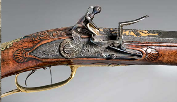
Steinschlossbüchse des Markgrafen Friedrich, 1729 u. 1738 (o.); Silberne Jagdhornmundstücke mit Etui, um 1780 (u.)

Anhand kostbarer Exponate werden alle Arten der höfischen Jagd vorgestellt. Besonders beliebt war die Treibjagd zu Pferd – Parforcejagd genannt –, bei der ein Hirsch über viele Stunden von Jägern und einer Hundemeute querfeldein bis zur völligen Erschöpfung gehetzt wurde. Mit einem Hirschfänger gab schließlich der Markgraf oder ein besonderer Gast dem völlig entkräfteten Tier den Fangstoß. Eine seltene Sammlung von Jagdgemälden zeigt den Ablauf einer solchen Jagd in allen Einzelheiten. Ausgestellt werden auch die dazugehörigen Hieb- und Stichwaffen, für die sich in der Jägersprache so ausgefallene Bezeichnungen wie Saufeder, Praxe, Bärenreisen oder Hirschplaute entwickelt haben. Dazu kommen einige der ältesten auf dem Kontinent erhaltenen Parforce-Jagdhüte, die vom Ansbacher Markgrafen Alexander aus England eingeführt wurden. Bei der Eingestellten Jagd wurden die Tiere zunächst aus der gesamten Umgebung zusammengetrieben.