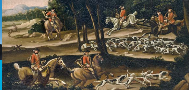
Die höfische Parforcejagd, Gemälde der Brüder Kleemann

Bayerischer Staatsminister der Finanzen und für Heimat