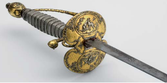
Jagdlicher Luxus-Galanteriedegen, Frankreich, um 1770