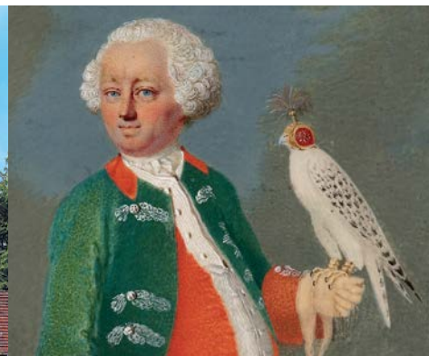
Der »Wilde Markgraf« als Falkner (li.); Jagdl. Glaskelch (re.)

Die 2011 in der Burg Zwernitz eröffnete Ausstellung stellt das höfische Jagdwesen in den beiden Markgrafentümern Ansbach und Bayreuth auf seinem Höhepunkt im 18. Jahrhundert vor. Als zentrales Ereignis höfischer Repräsentation nahm die Jagd auch hier – wie an allen Höfen des Barockzeitalters – eine herausragende Stellung ein. Fast alle Markgrafen aus dem Haus Hohenzollern waren passionierte Jäger. Nicht selten verschlangen die Kosten für die Jagd einen bedeutenden Anteil des Staatshaushalts. Da im Heiligen Römischen Reich Deutscher Nation das kaiserliche Recht (Regal) der Hohen Jagd auf Hirsche, Bären oder Wildschweine den Landesherren verliehen wurde, nutzten diese praktisch ihr gesamtes Territorium als fürstliches Jagdgebiet. Daher mussten im ganzen Land Jagdunterkünfte – mitunter sogar eigene Schlösser – unterhalten werden. Zahlreich war das Jagdpersonal, überall hielt man umfangreiches Jagdzeug vorrätig. Jagdaufenthalte dienten außerdem auch der Visite der verschiedenen Landesteile. Beeindruckende Ausstellungsstücke und aufschlussreiche Informationen ermöglichen einen spannenden Einblick in diese längst vergangene Welt der höfischen Jagd.