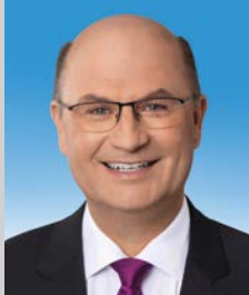
Albert Füracker, MdL Staatsminister

Wir wünschen Ihnen einen spannenden Besuch im Königshaus am Schachen!