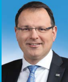
Martin Schöffel, MdL Staatssekretär

Wir wünschen Ihnen einen spannenden Besuch im Königshaus am Schachen!