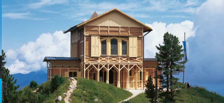
Das Schachenhaus wurde ab 1870 errichtet