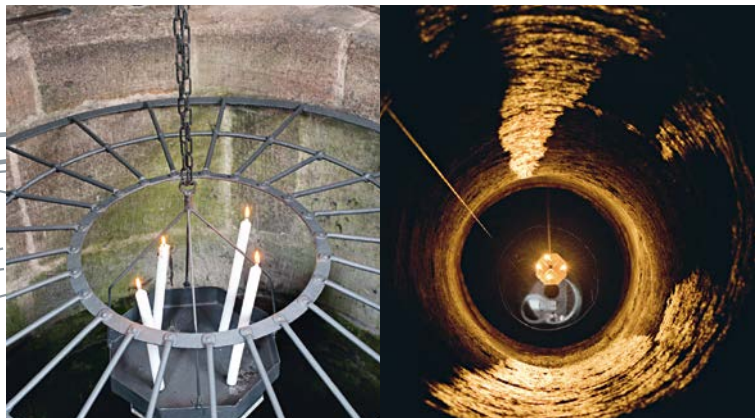
Blick in den Schacht des Tiefen Brunnens

Der Tiefe Brunnen im Zentrum der Vorburg entstand als autonome Wasserversorgung der Burg sicher schon in einer frühen Bauphase. Sein Schacht ist fast 50 Meter tief in den Burgfels getrieben, eine Tiefe, die mit einer Kamerafahrt und einer anschaulichen Führung nachvollzogen werden kann.