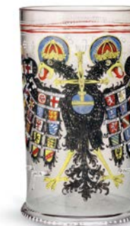
Siegel der Goldenen Bulle (Nachbildung), München, Bayerisches Hauptstaatsarchiv (oben); Merkel'scher Tafelaufsatz, Museen der Stadt Nürnberg (Mitte); Reichsadlerhumpen, 17. Jahrhundert (rechts)