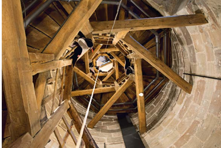
Blick in das Treppenhaus des Sinwellturms