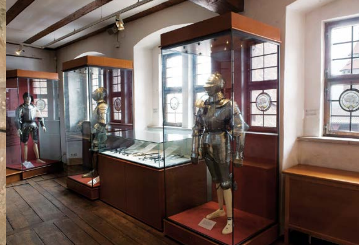
Blick in die Ausstellungsräume in der Kemenate