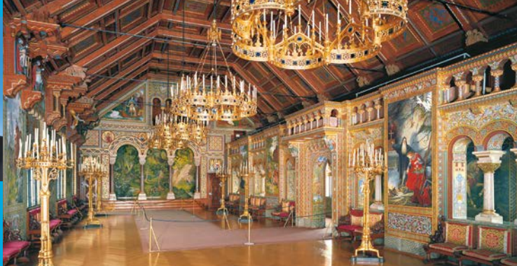
Der Sängersaal im vierten Geschoss des Palas