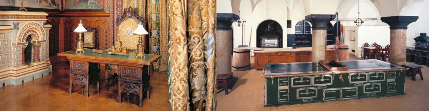
Arbeitszimmer mit Schreibtisch Ludwigs II.