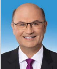
Albert Füracker, MdL Bayerischer Staatsminister der Finanzen und für Heimat

Wir wünschen Ihnen einen spannenden Besuch in Schloss Neuschwanstein!