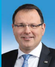
Martin Schöffel, MdL Staatssekretär im Bayerischen Staats- ministerium der Finanzen und für Heimat

Wir wünschen Ihnen einen spannenden Besuch in Schloss Neuschwanstein!