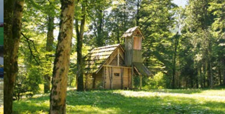
L'Eremo di Gurnemanz

di Venere. Tra il 1878 e il 1881 la Grotta ricevette una propria illuminazione elettrica, estremamente moderna per l'epoca. Con l'ausilio di dispositivi in vetro colorato intercambiabili la grotta veniva immersa in differenti tonalità cromatiche. La Grotta di Linderhof con la sua tecnica illusionistica, ai suoi tempi molto innovativa, è uno dei più affascinanti esempi dell'anelito del XIX secolo verso la maggior perfezione possibile dell'opera d'arte totale. L' Eremo di Gurnemanz è un rifugio a forma di cappella. Fa parte della scenografia del terzo atto del dramma mistico 'Parsifal' di Richard Wagner. Ludovico II rievocava qui, in solitudine, la Trama di questa opera e leggeva poemi medievali.