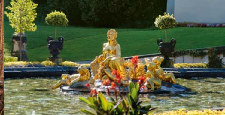
Gruppo di statue della Fontana di Flora davanti al Castello reale

parco circostante con l'aggiunta dei suoi edifici esotici. Gli edifici del parco, la Casa Marocchina e il Chiosco Moresco, si inseriscono nel filone della moda orientale coltivata anche da Ludovico II. Le tre 'scenografie' inserite nel parco: la Capanna di Hunding, l'Eremo di Gurnemanz e la Grotta di Venere sono da collocare nell'ambito della venerazione di Ludovico II per i drammi musicali di Richard Wagner. Il circostante paesaggio naturale alpino è inserito in questa geniale opera d'arte totale grazie ad assi prospettici e lunghi sentieri chilometrici che conducono nei boschi circostanti.