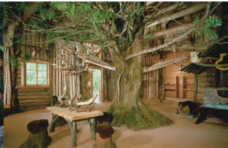
Interno della Capanna di Hunding con il tronco di frassino

La Capanna di Hunding rappresenta una casa germanica. Questa scenografia per il primo atto del dramma musicale 'La Valchiria' di Richard Wagner venne costruita esattamente in base alle sue indicazioni di regia. Qui Ludovico II leggeva saghe germaniche e nordiche, mentre sullo sfondo dei servitori in abbigliamento germanico formavano uno sfondo vivente.