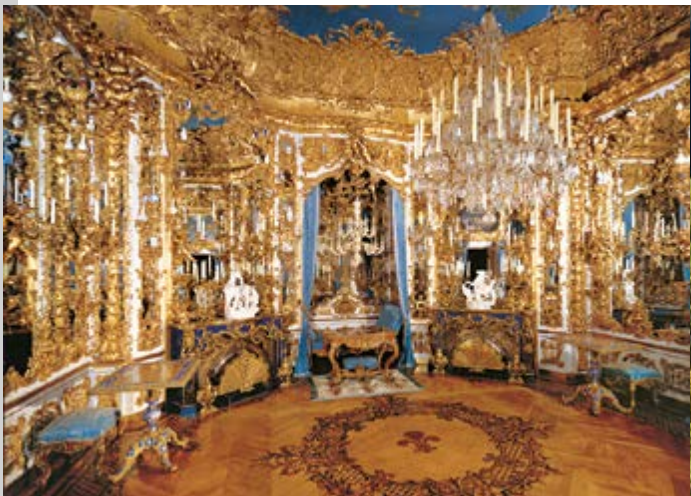
La Sala degli Specchi

Camere Opulente della Residenza di Monaco di Baviera. La ricchezza e la densità degli ornamenti con molti elementi di grande plasticità non sono pura e semplice imitazione. Nel Castello di Linderhof Ludovico II creò stanze di una sfarzosità fantasmagorica che vanno ben oltre ogni modello di riferimento. Anche la qualità di esecuzione artigianale non teme alcun confronto.