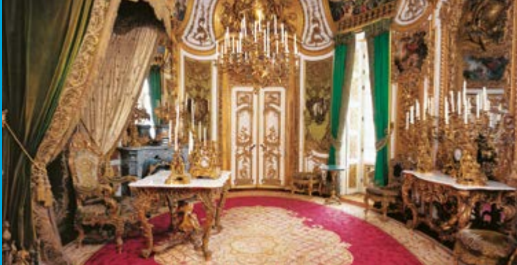
La Camera delle Udienze o Studio del Castello reale

Bayerischer Staatsminister der Finanzen und für Heimat