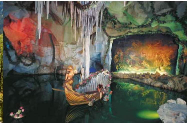
La grotta artificiale di Venere

La Grotta di Venere è una grotta artificiale con stalattiti e stalagmiti, scavata a partire dal 1875 dentro la montagna. Lo scenario della 'Grotta di Venere' è mutuato dal 1° atto dell'opera 'Tannhäuser' di Richard Wagner ed è disposto in base alle sue indicazioni di regia. L'enorme dipinto mostra la scena del Monte