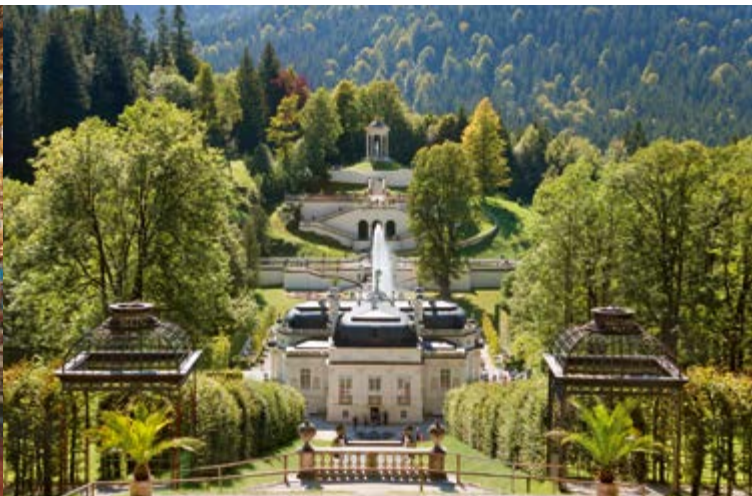
Vista dalla cascata sul Castello e sui giardini terrazzati

Il parco del castello di Linderhof è uno dei più pregevoli della sua epoca. Esso combina elementi del giardino barocco francese con quelli del giardino paesaggistico inglese. Barocche sono le terrazze con vasche d'acqua disposte sugli assi mediani e trasversali del castello, così come le aiuole geometriche, la lunga cascata e la fontana con figure. Di chiara ispirazione barocca sono anche i due punti prospettici del Padiglione e del Tempio di Venere. A modelli inglesi si ispira invece la disposizione irregolare e naturale del