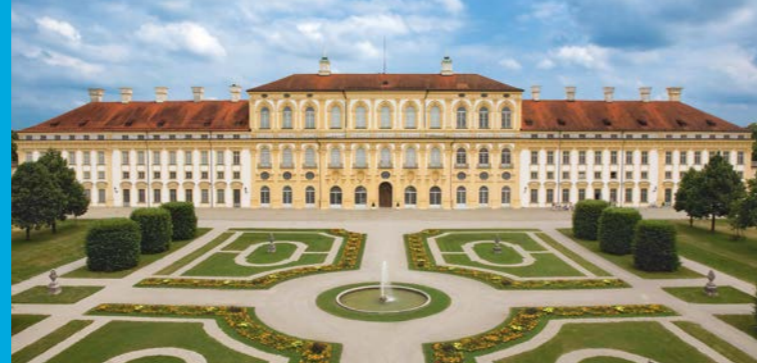
Neues Schloss Schleißheim

Bayerischer Staatsminister der Finanzen und für Heimat