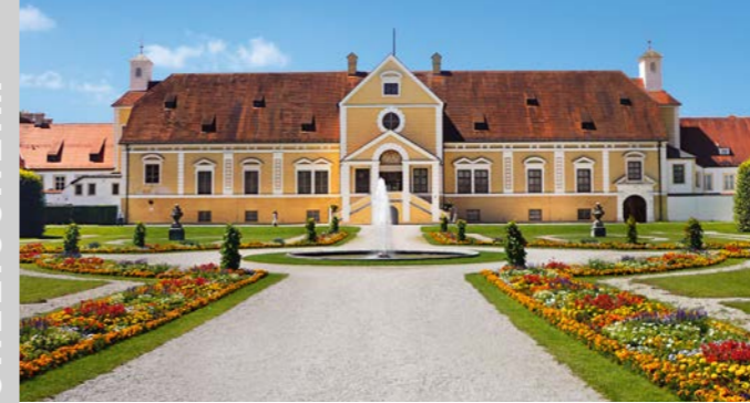
Altes Schloss Schleißheim

Großer Saal mit Deckenfresko, Jacopo Amigoni, 1722 (li.); Paradeschlafzimmer im Appartement des Kurfürsten (re.)