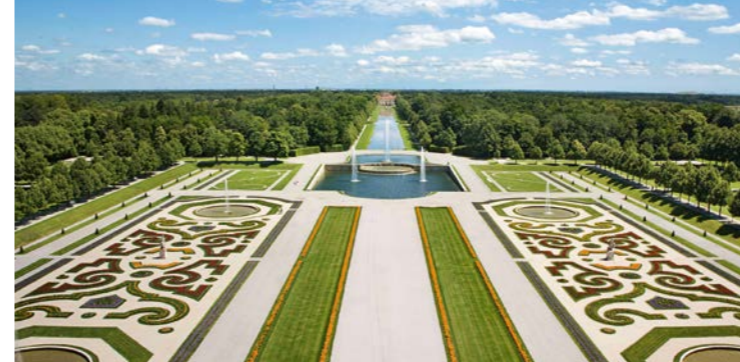
Blick vom Neuen Schloss Schleißheim über das Parterre, die Kaskade und den Mittelkanal zu Schloss Lustheim